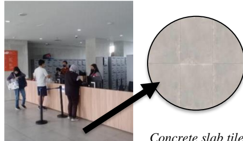
Concrete slab tile

yang dipakai pada lantai hampir pada seluruh bangunan ini. Warna pada lantai menggunakan warna abu-abu yang bertujuan untuk memberikan kesan industrialis sesuai dengan konsep perpustakaan. Selain itu warna abu-abu yang dipakai pada elemen lantai dan dinding menciptakan perasaan tenang saat melakukan kegiatan di dalam perpustakaan cikini ini.