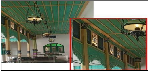
Gambar 3. Ornamen Bangunan

Ukiran kayu khas Jawa tetap digunakan, tetapi terdapat tambahan motif geometris khas Eropa.