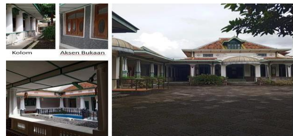
Gambar 1. Struktur Bangunan

Struktur atap Joglo tetap dipertahankan, tetapi beberapa bagian rumah memiliki sentuhan arsitektur Eropa, seperti penggunaan-penggunaan kolom-kolom besar, lengkungan pada bukaan, warna dinding, dan ukiran atau ornament khas kolonial.