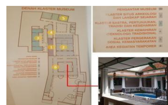
Gambar 2. Denah Bangunan

Tata ruang mempertahankan pola rumah tradisional Jawa dengan pembagian antara ruang public (pendopo), semi-publik (pringitan), dan privat (omah njero dan senthong).